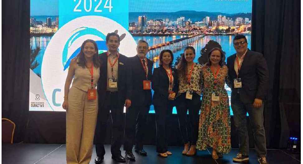
Participantes módulo "SOCHIOF al día"