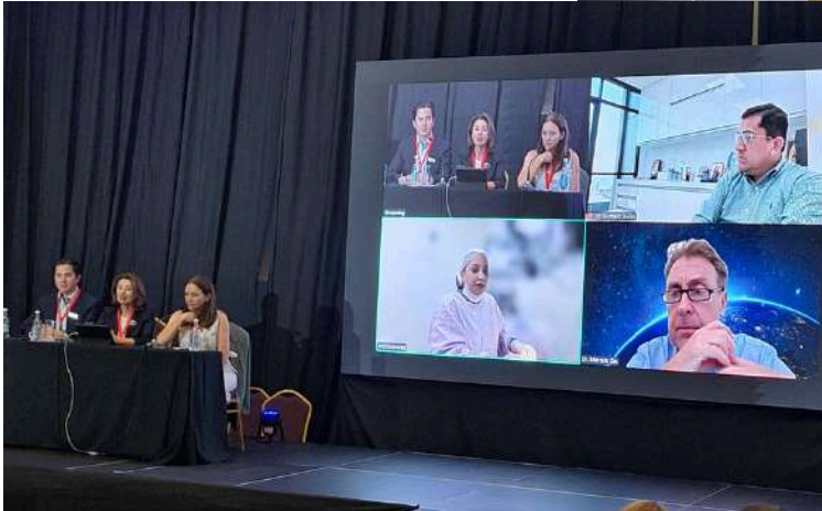
Mesa redonda presidentes Sociedades latinoamericanas

En el módulo SOCHIOF al día se realizó una mesa redonda con presidentes de Sociedades latinoamericanas que analizaron el desarrollo, transformación e importancia del rol gremial.